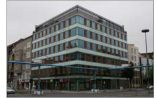
Lietzenburger Str. 53, Berlin

Bauvorhaben : Bundesdruckerei, Berlin Gebäudeart : Industriebau (Neubau) Umfang/ Besonderheiten : Fertigungsgebäude mit nutzungsoffenen Bürogeschossen Vollsprinklerung nach VdS, Gaslöschanlagen (Inergen) für EDV- Räume Aufgabengebiet : Fachplanung Sanitär- und Feuerlöschtechnik 1) bearbeitete Leistungsphasen : Lph. 5 – 7 gemäß HOAI, § 73