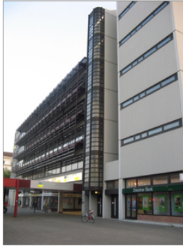
DRV- BT. D, Berlin