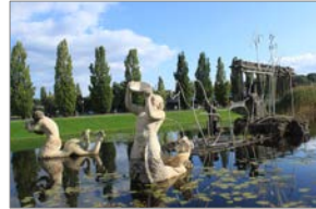
Neuer Lustgarten, Potsdam