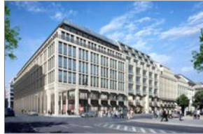
Upper Eastside, Berlin