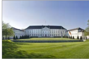
Schloß Bellevue, Berlin