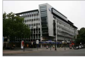
Kurfürstendamm 40-41, Berlin