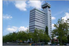
RBB- Fernsehzentrum, Berlin