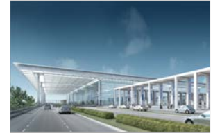
BBI, Berlin- Brandenburg