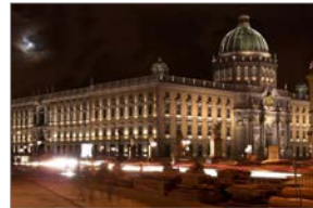
Humboldt-Forum / Berliner Schloß

Bauvorhaben : Deutsche Rentenversicherung, Berlin Gebäudeart : Verwaltungsgebäude (Bestand) Umfang/ Besonderheiten : Verwaltungsgebäude BT. D, Dienstgebäude Ruhrstraße, Hochhaus, Umbau im Bestand Aufgabengebiet : Fachplanung Feuerlöschtechnik 3) bearbeitete Leistungsphasen : Lph. 5 bis 7 gemäß HOAI, § 73, Mitwirkung bei Lph 8