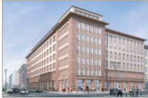
Quartier 110, Berlin